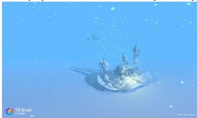
Рисунок 9. Tilt Brush

Даже если ребёнок не будет связывать свою дальнейшую жизнь с искусством, вполне вероятно, что к моменту, когда он будет получать профессиональное образование, проектирование в виртуальной реальности для многих специальностей станет обычным делом. К сожалению, VR-шлемы, необходимые для этой программы, всё ещё довольно дорогое оборудование (рис. 9).