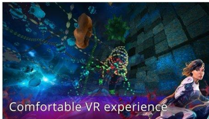
Рисунок 11. InCell VR (Cardboard)