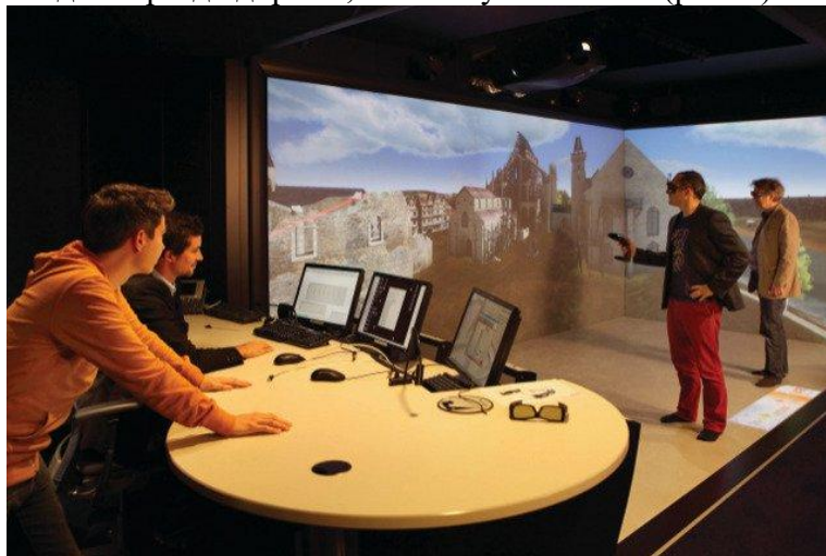
Рисунок 1. Комната VR.

Альтернатива для тех, кто не хочет испортить прическу — изображения в данном случае транслируются не в шлем, а на стены помещения, часто представляющие собой дисплеи MotionParallax3D (хотя для более полного UX в некоторых таких комнатах нужно надевать 3D-очки или даже комбинировать CAVE и HMD). Есть мнение, что VR-комнаты гораздо лучше VR-шлемов: более высокое разрешение, нет необходимости таскать на себе громоздкое устройство, в котором некоторых даже укачивает, и самоидентификация происходит проще благодаря тому, что пользователь имеет возможность постоянно себя видеть. Тем не менее, приобретение такой комнаты, понятное дело, выйдет гораздо дороже, чем покупка шлема (рис. 1).