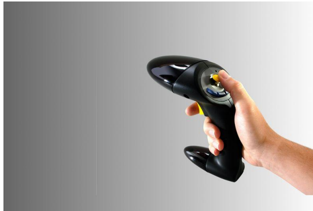
Рисунок 3. Джойстик.

Специальные устройства для взаимодействия с виртуальной средой, содержащие встроенные датчики положения и движения, а также кнопки и колеса прокрутки, как у мыши. Сейчас их все чаще делают беспроводными, чтобы избежать неудобств и нагромождений при подключении к компьютеру (рис. 3).