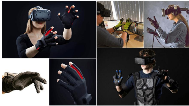
Рисунок 2. Информационные перчатки.