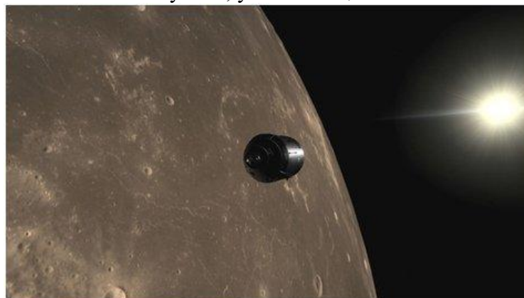
Рисунок 12. Apollo 11 VR

Titans of Space VR - обучающее приложение, которое позволит вам принять участие в экскурсии по Солнечной системе. Трёхмерные модели планет с детальной прорисовкой всех континентов и океанов, реалистичная анимация движения атмосферы Юпитера - одним словом такого вы не увидите даже в фантастических фильмах! Вдобавок к этому в течение всего полета нас будет сопровождать спокойная классическая музыка, усиливающая впечатление от увиденного.