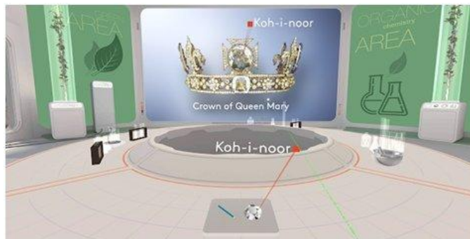
Рисунок 8. MEL Chemistry VR Уроки химии